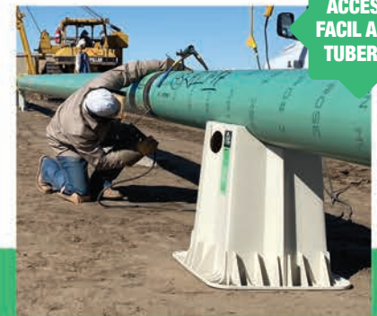
Asa Lateral Integrada